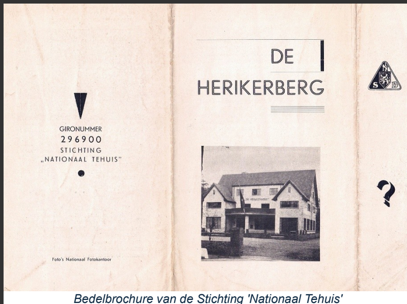
Bedelbrochure van de Stichting 'Nationaal Tehuis'