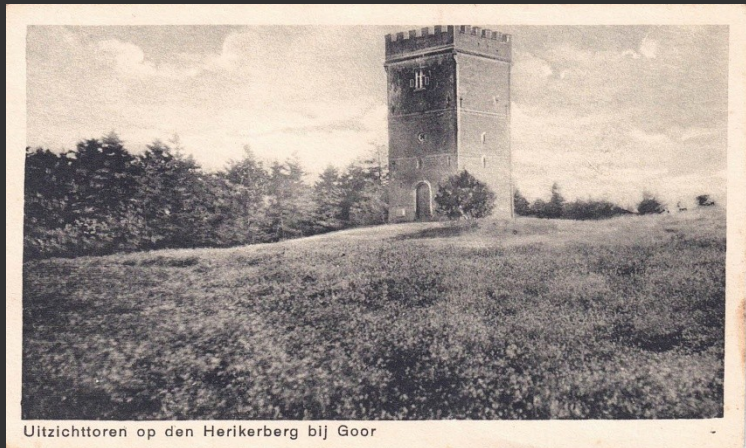
Uitzichttoren op den Herikerberg bij Goor

Als de NSB haar huiswerk had gedaan dan had ze kunnen weten dat voor haar grootste plannen op die locatie praktisch beleid en wetgeving in de weg stonden. De gemeente Markelo werkte aan een uitbreidingsplan. Onderdeel daarvan was een natuurbeschermingsbeleid: 'De genoemde maatregel