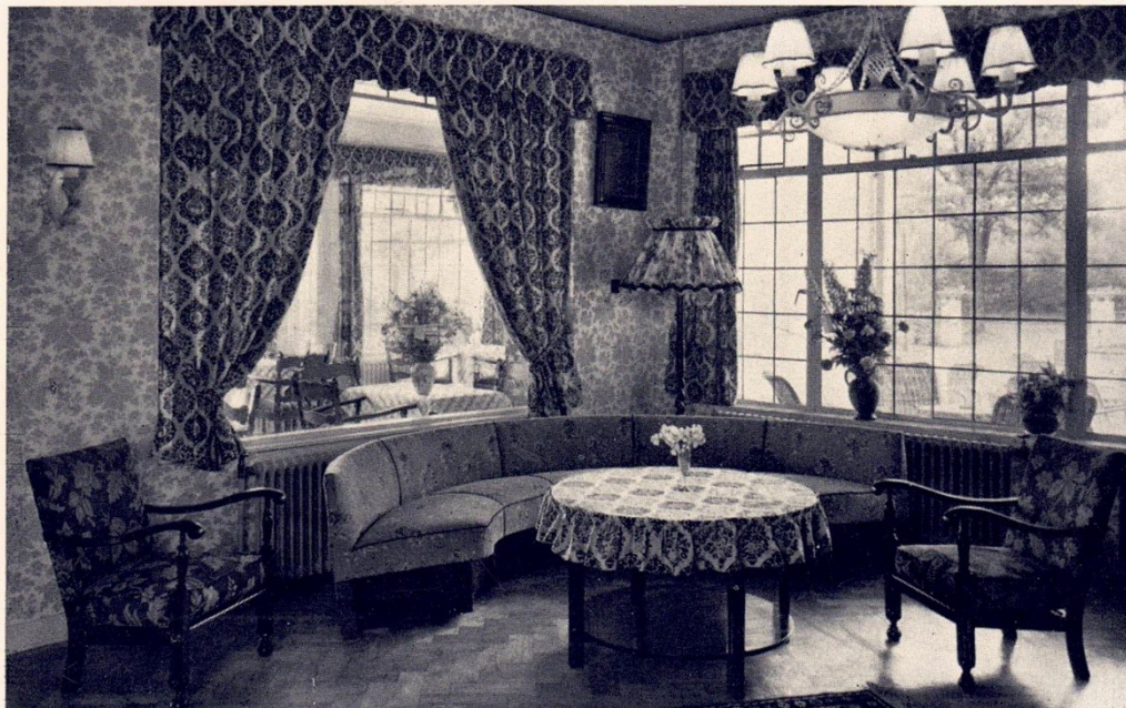
Ansichtkaart uit de jaren 50. Op de achterkant staat: 'Gezellig zitje in de Conversatiezaal'

Zover kwam het niet. Notaris Teesselink kondigde al een maand later de openbare verkoop aan van het hotel met bijgebouwen. Op 17 maart zouden de enveloppen van de inschrijvers geopend worden. Belangstellenden konden bij hem de sleutel ophalen voor een