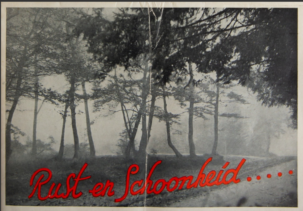
foto en de tekst ' Rust en Schoonheid..... '. Na openslaan bleek het te gaan om 'de Herikerberg'. De foto van de zon door de bomen in een bos verklapte verder nog niets. De naam rinkelde ook geen enkele bel. Na foto's van jaargetijden, die tijdens het verder openvouwen tevoorschijn kwamen, bleek de achterkant van de folder een wervingsposter te zijn voor hôtel-pension 'De Herikerberg' . Wat mij opviel was een portret van Anton Mussert aan de muur van een, volgens de tekst bij de foto, ' in oud-Hollandsche stijl gehouden ' zitkamer waar men ' verrukkelijk uitzicht

Tussen allerlei interessant fout papierwerk dook een op eerste gezicht vreemde eend in de bijt op: een folder van een hotel ik Markelo. Waar ik normaal zo'n folder laat liggen voor de onversaagd snuffelende verzamelaar van 'oude folders van bedrijven in Markelo' onderwierp ik dit keer de folder aan een nadere inspectie. Het was een vouwfolder met een