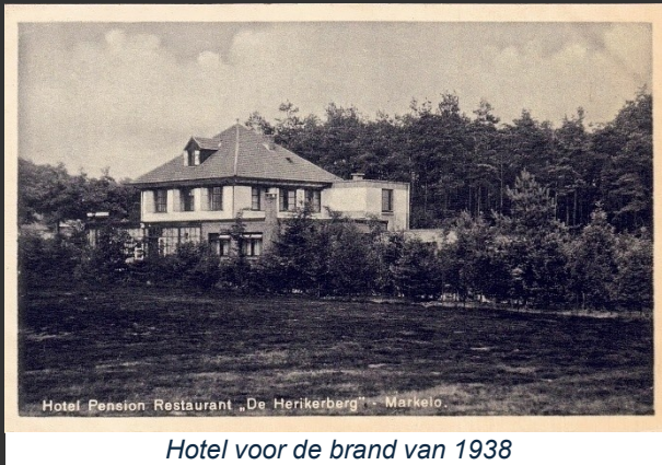
Hotel voor de brand van 1938

Markelo haalde eind september 1938 het landelijk nieuws. Bijna alle kranten schreven over de brand in het bekende hotel-pension De Herikerberg. Het pand lag bovenop de gelijknamige ruim 46 meter hoge 'berg' op een perceel van vijf hectare. Behalve het hotel stonden daarop ook zes landhuisjes waarin per huisje vijf gasten konden verblijven. In korte tijd brandde het hotel af. Uitrukken van de brandweer was zinloos, want er was geen 'bluschwater' op de berg, aldus de verslagen in de kranten. Militairen uit de buurt wisten een deel van de inboedel te redden: 'Alles werd naar buiten gesleept. Ook uit de slaapkamers werd nog menig meubel gered. Rondom het brandende hotel was het in een ommezien een chaos van alle mogelijke voorwerpen. Schilderijen, antieke vazen, matrassen, een Friesche hangklok lagen door en over elkaar tusschen het groen van de dennenbosschen opgestapeld. Ondanks energieke pogingen kon men niet verhinderen, dat er ook nog veel van den inboedel een prooi der vlammen werd, o.a.